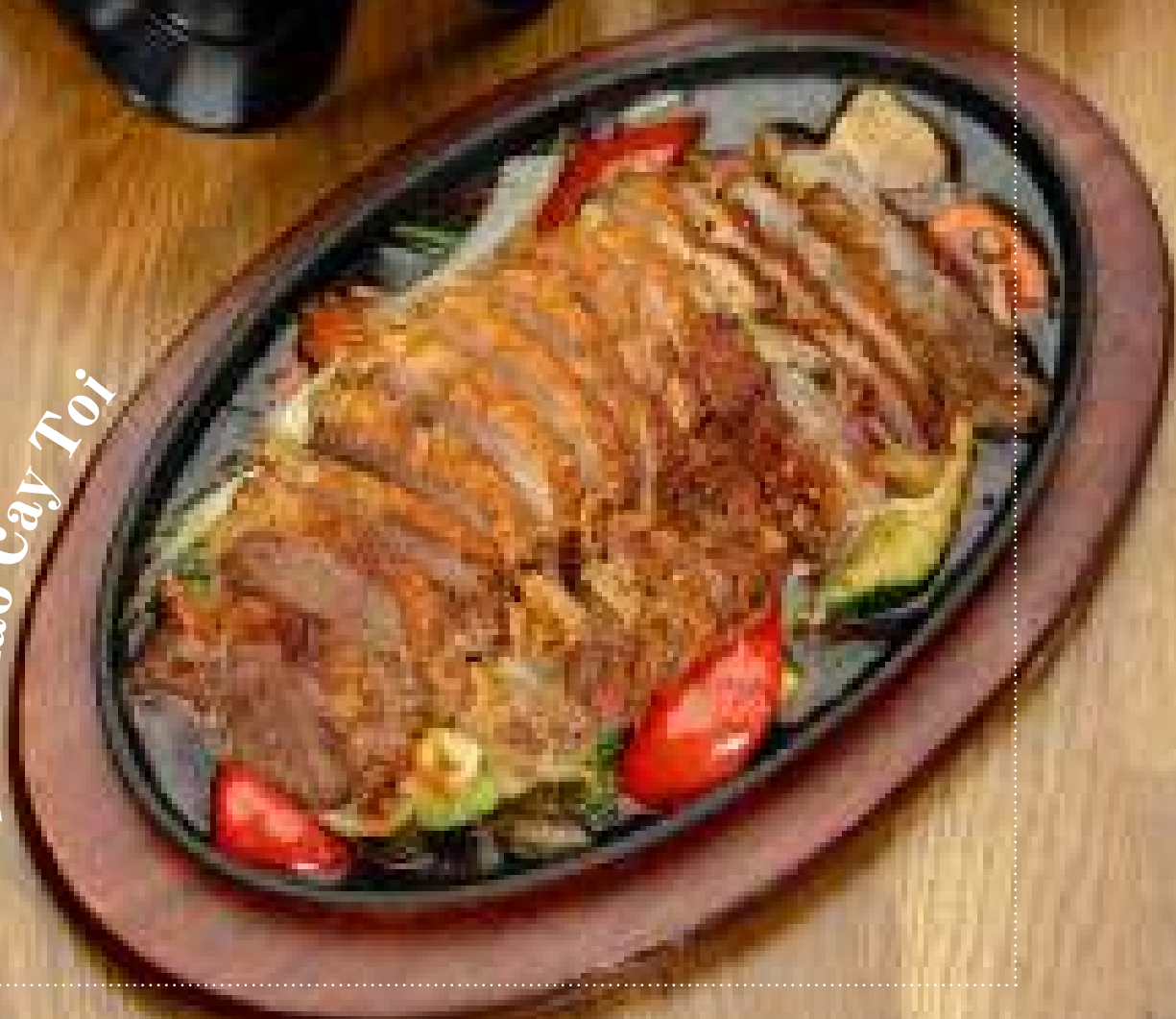
Rau Xao Cay Toi