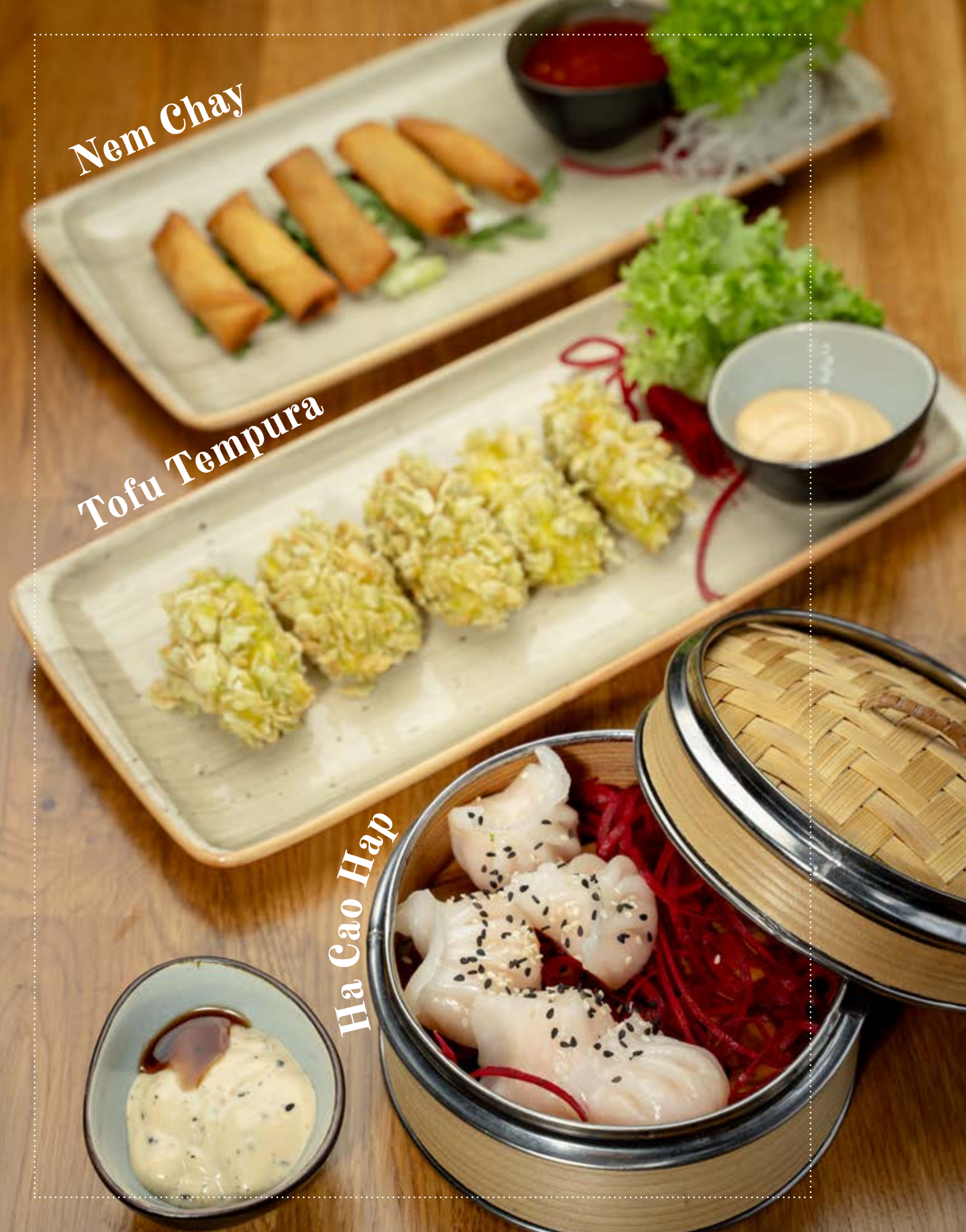
Ha Cao Hap